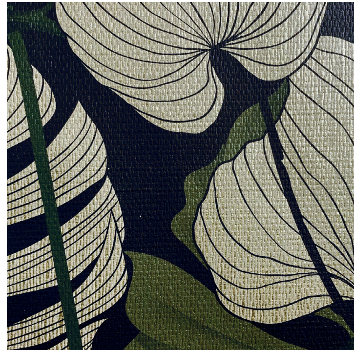
FOTO CAMPIONE LUXURY FIBER / PHOTO SAMPLE OF LUXURY FIBER