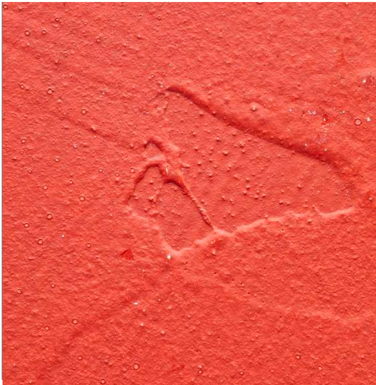
FOTO CAMPIONE MALTA LACCATA / PHOTO SAMPLE LACQUERED MORTAR

Via Della Massera, 2 - 47016 Predappio www.momenti-casa.it info@momenti-casa.it +39 0543 922982