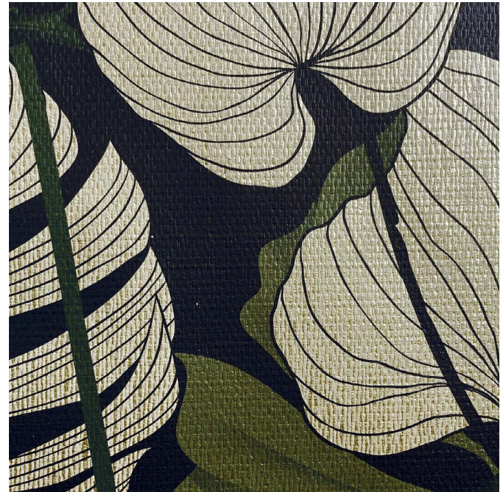
FOTO CAMPIONE LUXURY FIBER / PHOTO SAMPLE OF LUXURY FIBER