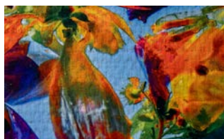
Stampa digitale su Tecno Fiber / Digital print on Tecno Fiber